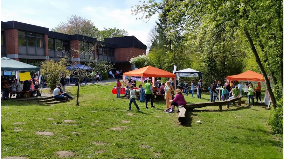
Das traditionelle Spielfest unserer Heilpädagogischen Tagesstätte in Zusammenarbeit mit den Offenen Hilfen und der Kommunalen Jugendarbeit